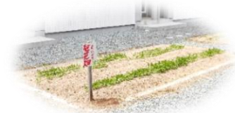
紅花の芽を出した畑

■ 今年度、まいづる学級では、地域の方々を講師にお招きして畑を作り、紅花の種を植えるところから、収穫、紅花染め等々を行う『紅花プロジェクト』を行っています。